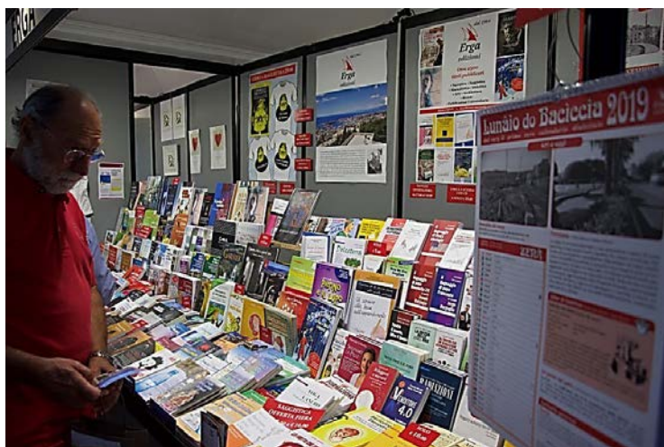
Lo stand Erga al Book Pride 2018

Erga edizioni Mura delle Chiappe 37/2 – 16136 Genova Tel 010 8328441 – Mail edizioni@erga.it Catalogo e recensioni on line www.erga.it Facebook: www.facebook.com/ErgaEdizioni Twitter: twitter.com/ergaedizioni Instagram: www.instagram.com/ergaedizioni